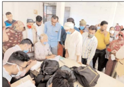
शिविर में निःशुल्क आंखों के ऑपरेशन का फार्म भरते डॉक्टर।